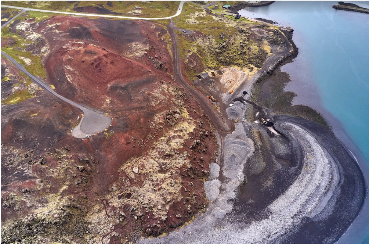
Mynd 2.1: Skansfjara, að Skansinum.