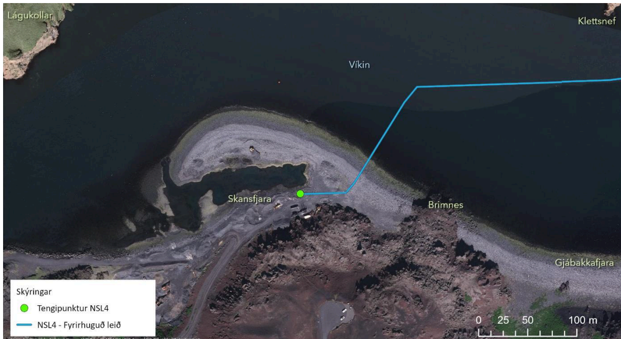
Mynd 2.2: Áformuð lega nýrra vatnslagnar um innsiglinguna og með landtöku í Skansfjöru.

Framkvæmdinni er lýst í greinargerð með fyrirspurn um matsskyldu, sem er fylgiskjal með þessari tillögu um aðalskipulagsbreytingu og hluti af henni. Áformuð lega nýju vatnslagnarinnar er eins og mynd 2.2 sýnir, hér fyrir neðan.